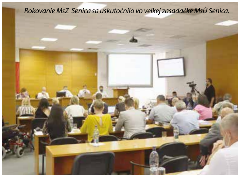
Rokovanie MsZ Senica sa uskutočnilo vo veľkej zasadačke MsÚ Senica.