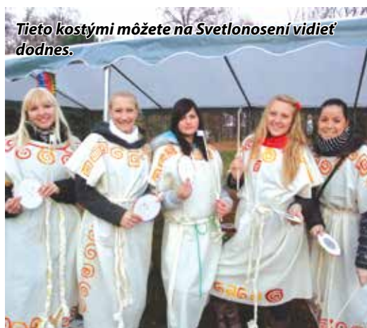
Tieto kostými môžete na Svetlonosení vidieť dodnes.