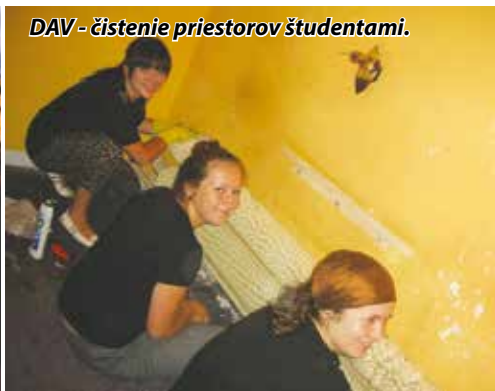
DAV - čistenie priestorov študentami.