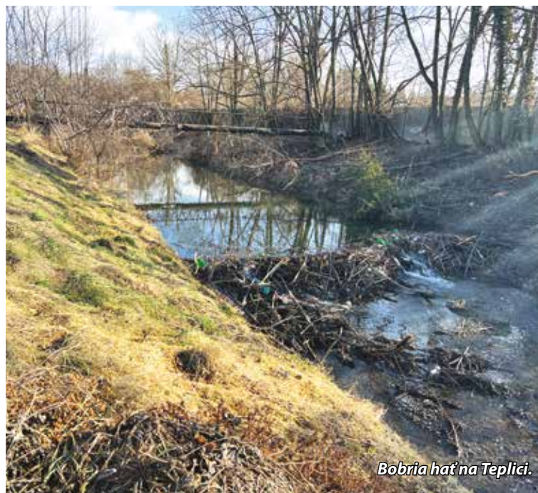
Bobria hať na Teplici.

výskytu a činnosti bobrov, ktorú aj v Senici priebežne monitorujeme a vyhodnocujeme. Máme také skúsenosti, že bobry spotrebávaním náletovej stromovej vegetácie sčasti sanujú povinnosti vodohospodárov, ktorým starostlivosť o korytá riek a potokov náleží