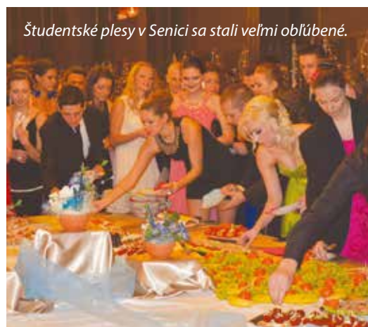
Študentské plesy v Senici sa stali veľmi obľúbené.