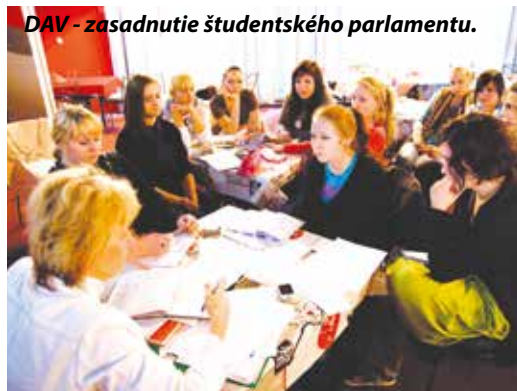
DAV - zasadnutie študentského parlamentu.