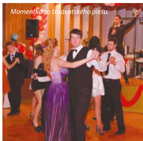
Momentka zo študentského plesu.