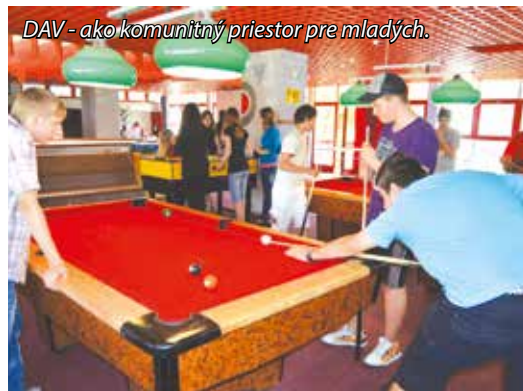
DAV - ako komunitný priestor pre mladých.