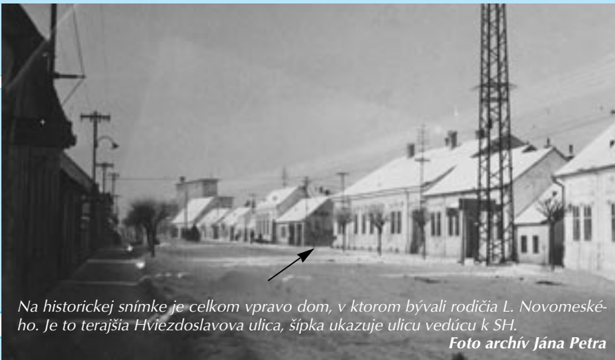
Na historickej snímke je celkom vpravo dom, v ktorom bývali rodičia L. Novomeského. Je to terajšia Hviezdoslavova ulica, šípka ukazuje ulicu vedúcu k SH.