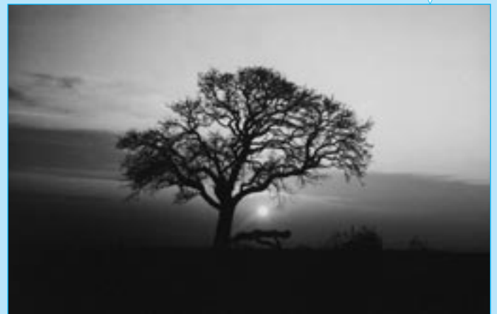
Vladimír Třeška: Pri strome I.