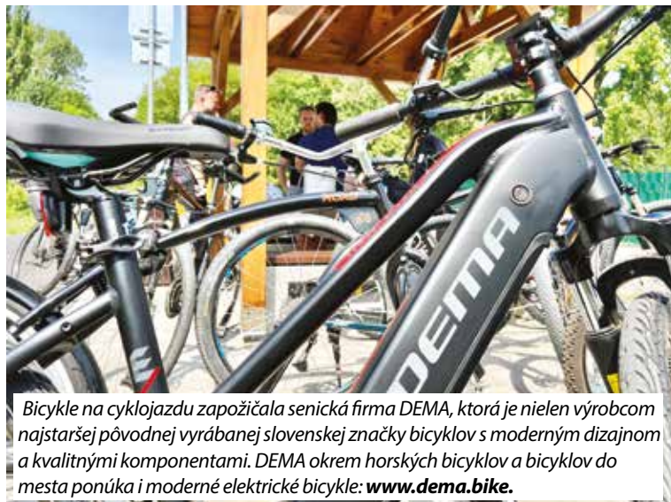
Bicykle na cyklojazdu zapožičala senická firma DEMA, ktorá je nielen výrobcou najstaršej pôvodnej vyrábanej slovenskej značky bicyklov s moderným dizajnom a kvalitnými komponentami. DEMA okrem horských bicyklov a bicyklov do mesta ponúka i moderné elektrické bicykle: www.dema.bike .

Bezpečnosť celého úseku cyklodopravných trás by sa mala zvýšiť aj vďaka vybudovaniu nového verejného LED osvetlenia priechodov pre chodcov, celkovo takýchto bezpečných priechodov pribudlo po celej trase dvadsať, a to na uliciach Dlhá, Vajanského, Sadová a Sotinská.