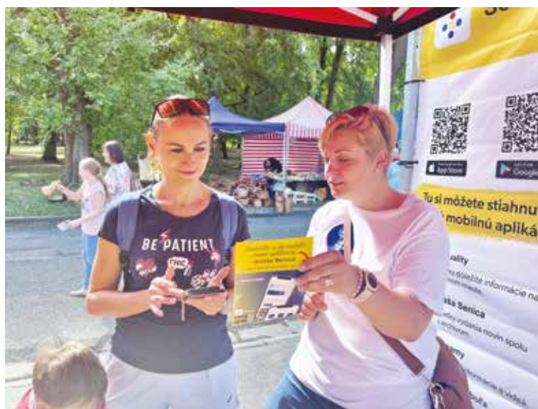
Senická radnica premiérovou predstavila mobilnú aplikáciu na tradičnom letnom podujatí Senické senobranie v sobotu 20. augusta.

V týchto dňoch je už aplikácia k dispozícii na stiahnutie v Google play