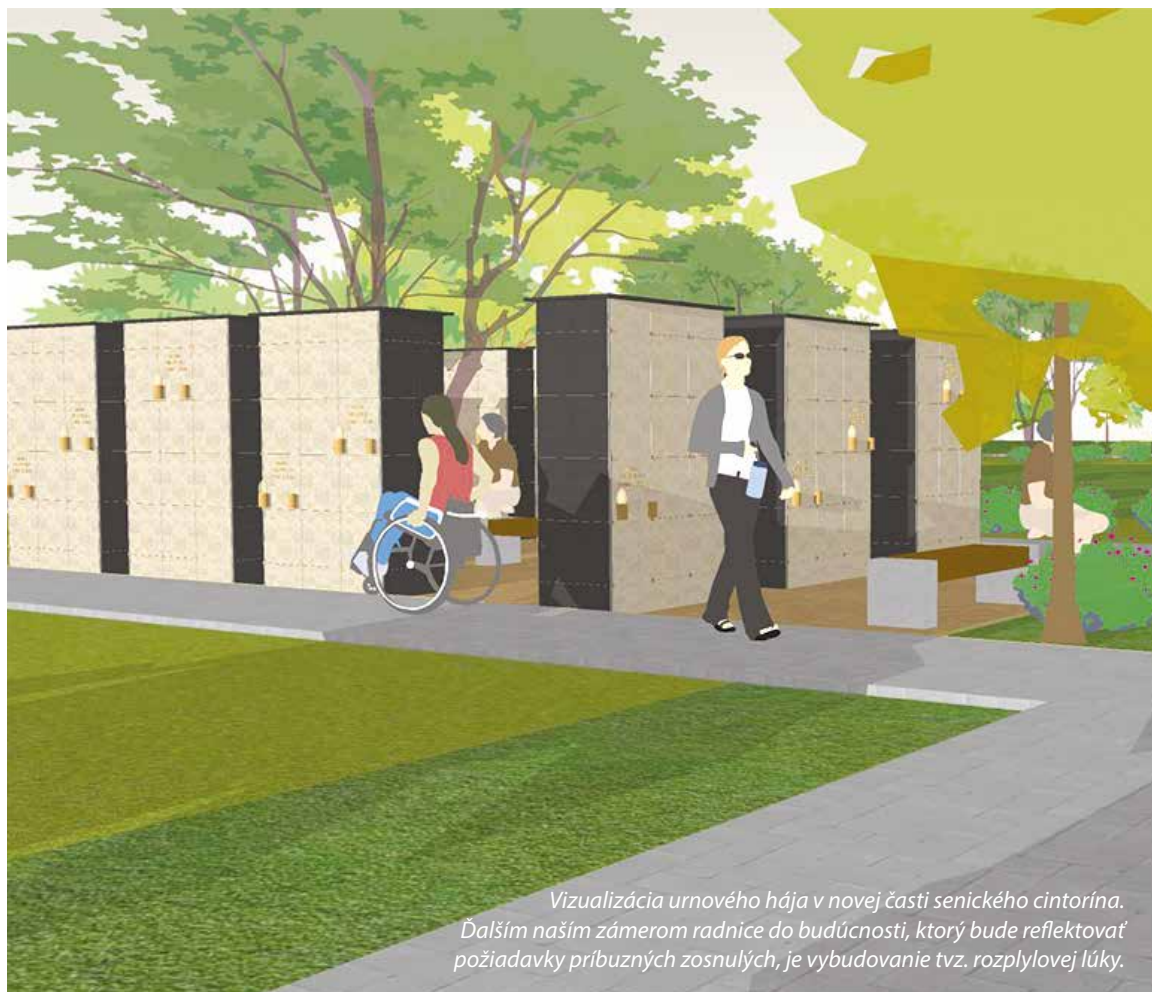
Vizualizácia urnového hája v novej časti senického cintorína. Ďalším naším zámerom radnice do budúcnosti, ktorý bude reflektovať požiadavky príbuzných zosnulých, je vybudovanie tzv. rozplylovej lúky.

Prvá etapa kolumbária na cintoríne v Senici by mala byť hotová do konca novembra 2022. V minulom roku sa v Senici uskutočnilo 220 pohrebov, z tohto počtu bolo 130 pohrebov vykonaných do zeme a spolopnenie tiel svojich blízkych si zvolilo 90 pozostalých. T. Moravcová