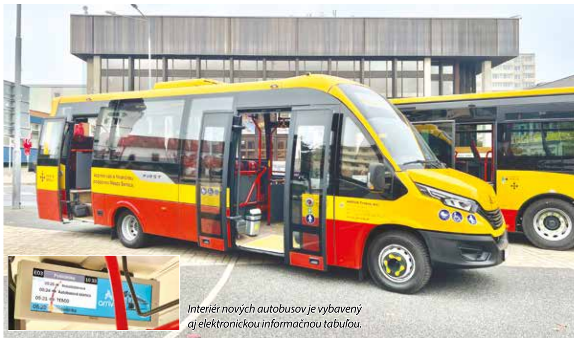
Interiér nových autobusov je vybavený aj elektronickou informačnou tabuľou.

Nové autobusy pribudli do vozidlového parku Arriva Trnava, a. s., ktorá prevádzkuje MHD v Senici a ktorá bola úspešná vo verejnej obchodnej súťaži, ktorú vyhlásilo mesto Senica vlani. Predmetom zákazky bolo prevádzkovanie kvalitnej MHD na území mesta Senice na obdobie 10 rokov, na 120 tisíc odjazdených kilometrov za kalendárny rok, s predpokladanou hodnotou viac ako 4,1 milióna eur. Úspešný dopravca – Arriva Trnava získal zmluvu na prevádzkovanie