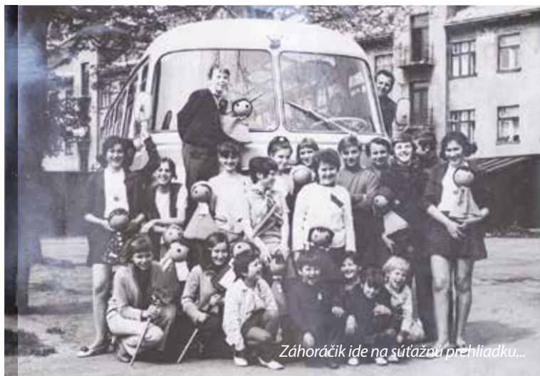
Záhoračik ide na súťažnú prehliadku...