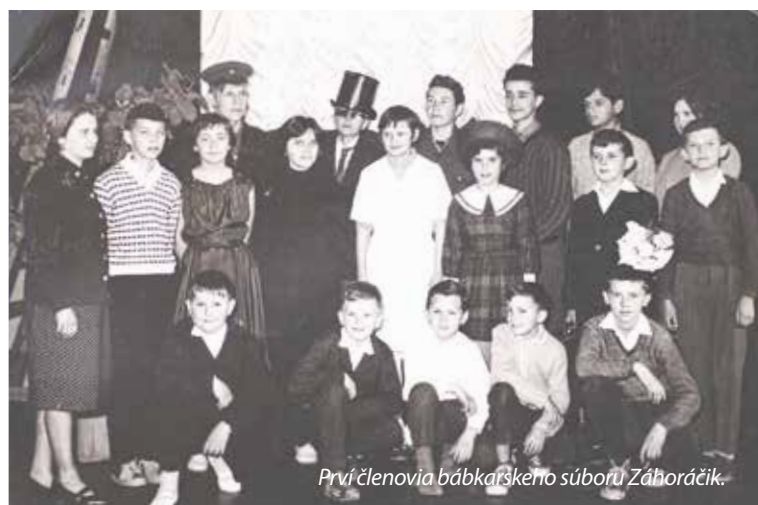
Prvých členov bábkarského súboru Záhoračik.

Záhoračik začal v sedemdesiatych rokoch používať hudobnú zložku a zvučnosť všetkých náležitostí na ozajstného malého divadla. Spolu s ODPM Senica v rokoch 1975 až 1978 organizoval v priestoroch starého kina Slovenského hodvábu okresné prehliadky bábkarských súborov. Nezvyčajných aktivít súboru si všim-