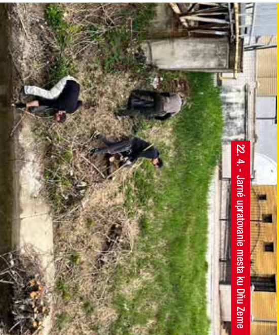
22. 4. - Jarné upratovanie mesta ku Dňu Zeme