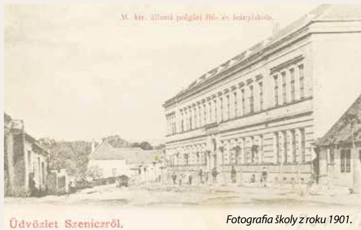
Fotografia školy z roku 1901.

Maďarská kráľovská štátna meštianska škola, ktorú aj v Senici volali polgárka, sa nachádzala na Kunovskej ulici (dnešnej Štefánikovej). Stávala na mieste, kde sú dnes tri dvanásťposchodové vežiaky. Na jej stavbu prispel štát a vyrástla na mieste bývalého zburaného pivovaru majiteľa