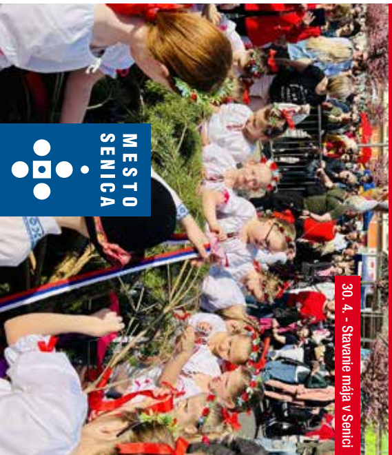
30. 4. - Stavanie mája v Senici