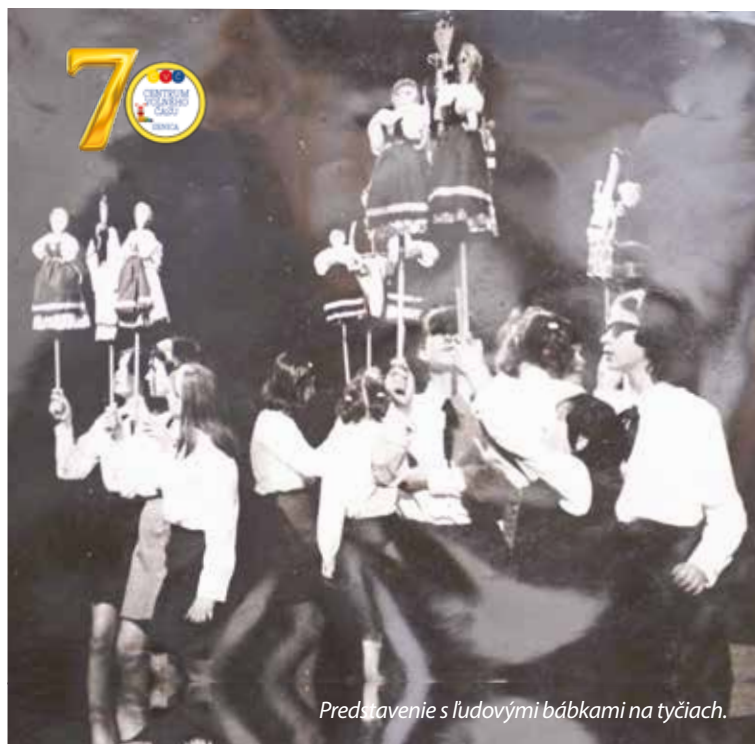
Predstavenie s ľudovými bábkami na tyčiach.