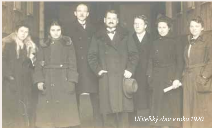
Učiteľský zbor v roku 1920.