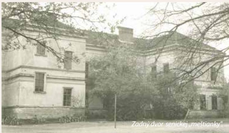
Zadný dvor senickej „meštianky“.