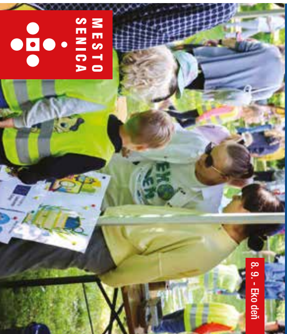
8. 9. - Eko deň