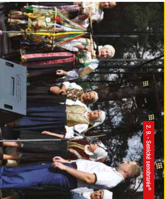
2. 9. - Senické senobranie®

28. september, od 7:00, do 14:00, Dom kultúry Senica