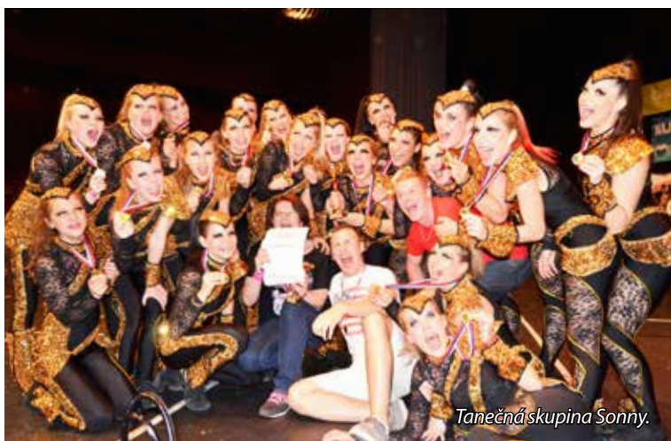
Tanečná skupina Sonny.

V jeho prvej dekáde 2003 – 2013 sa v CVČ darili veci nevidané. Vznikali ďalšie novinky, krúžky, podujatia, začínajú zaujímavá éra v DAVe, pribúdajú celoslovenské a medzinárodné ocenenia pre krúžky, svoj boom zažívajú autor-