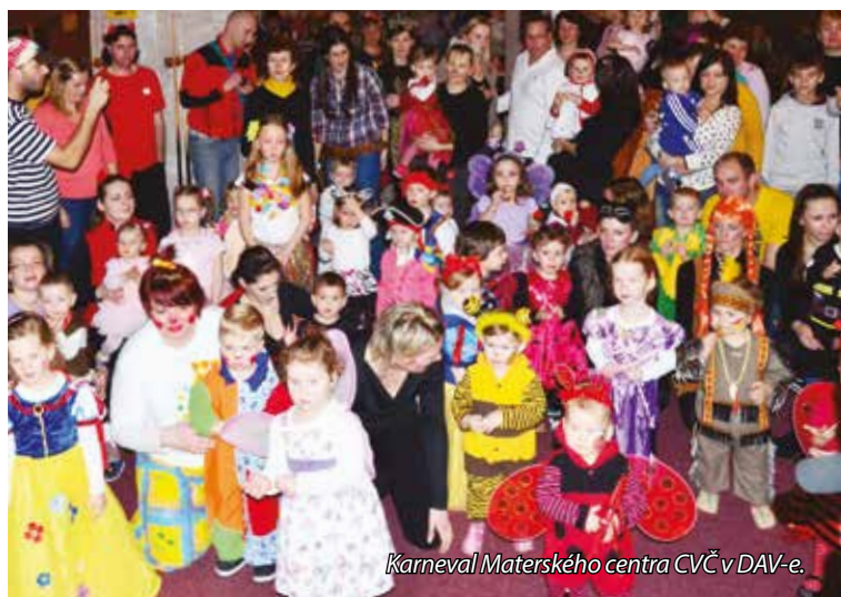
Karneval Materského centra CVČ v DAV-e.