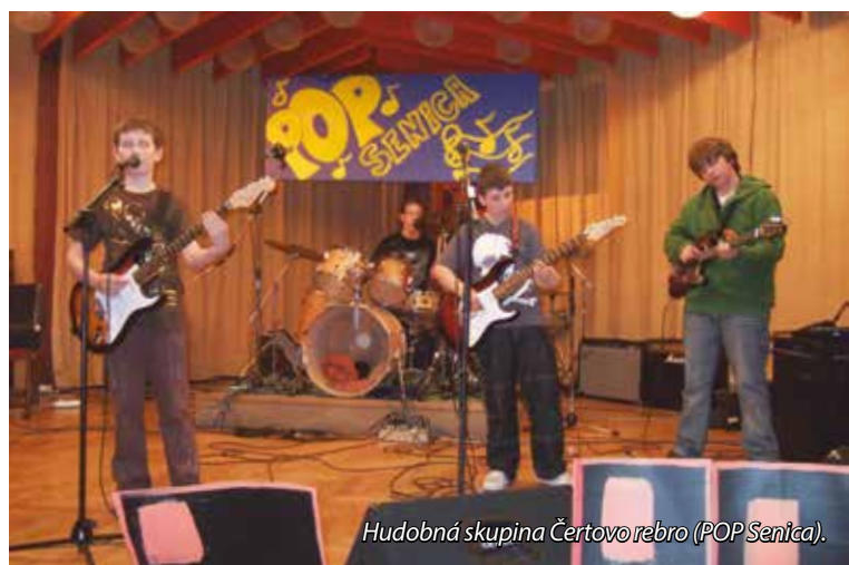
Hudobná skupina Čertovo rebro (POP Senica).