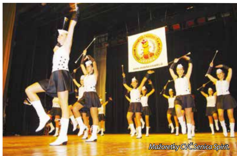
Mazoretky CVČ Senica Spirit.

ty, karnevaly, Dni Zeme, tábory, stovky vystúpení na verejnosti a stovky súťaží na Slovensku a v zahraničí, ktorých sa deti z krúžkov zúčastnili a často prinášali medailové umiestnenia.