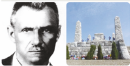
Dušan Samuel Jurkovič slovenský architekt, dizajnér a etnograf.

Záhorské múzeum v Skalici a Záhorské osvetové stredisko Senica