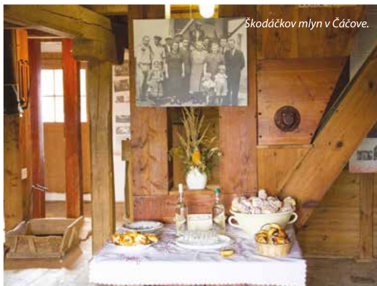
Škodáčkov mlyn v Čáčove.