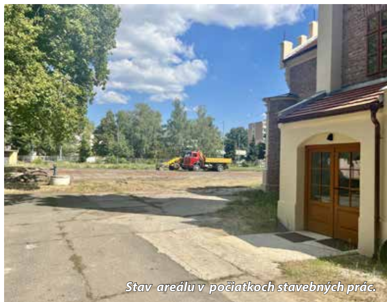
Stav areálu v počiatkoch stavebných prác.