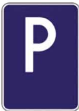
Zvislá dopravná značka pre označenie parkoviska.

Dočasné parkovanie – slúži na parkovanie a státi pre všetkých vodičov motorových vozidiel, na parkovacích miestach s plateným státím, ktoré sa nachádzajú na mestských parkoviskách, miestnych uliciach, či iných mestských verejných priestranstvách, ktoré slúžia mestskej doprave. Tieto parkovacie miesta sú vyznačené zvislým dopravným značením „parkovanie“ s dodatkovou tabuľkou „platené parkovanie“, prípadne ich kombináciou. Rovnako sú vyznačené vodorovným dopravným značením, zväčša čiarami modrej farby.