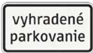
Dodatková tabuľa: Vyhradené parkovanie

Na týchto jednotlivých parkovacích miestach môže zaparkovať a stáť len motorové vozidlo, definované evidenčným číslom vozidla (EVČ), ktorého držiteľ/majiteľ splnil požadované podmienky a bolo mu mestom vydané povolenie na vyhradenie parkovacieho miesta.