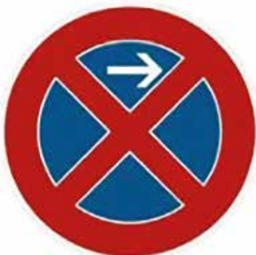
Zvislá dopravná značka: Zákaz zastavenia.

Trvalé parkovanie – slúži výhradne na parkovanie a státi pre vodičov s trvalým pobytom, resp. miestom, či sídlom podnikania v meste. Tieto miesta sú vyznačené zvislým dopravným značením „zákaz zastavenia“ (s vyznačením smeru platnosti) a dodatkovou tabuľkou „vyhradené parkovanie“. Taktiež sú vyznačené vodorovným dopravným značením – bielym krížom a číslom parkovacieho miesta.