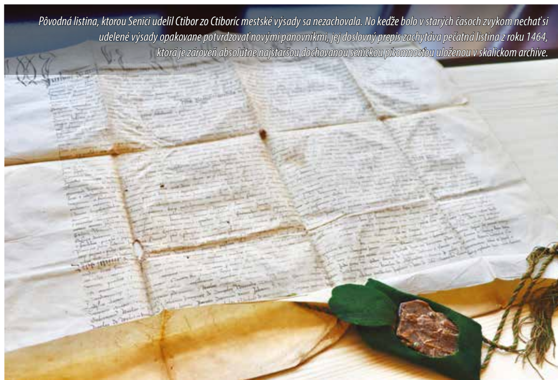
Pôvodná listina, ktorou Senici udelil Ctibor zo Ctiboríc mestské výsady sa nezachovala. No keďže bolo v starých časoch zvykom nechať si udelené výsady opakovane potvrdzovať novými panovníkmi, jej doslovný prepis zachytáva pečatná listina z roku 1464, ktorá je zároveň absolútne najstaršou dochovanou seničkou písomnosťou uloženou v skalickom archíve.

Na konci štrnásteho storočia – 24. júna 1396 udelil Stibor zo Stiboríc Senici mestské výsady, čím sa obec zaradila medzi mestské sídla typu oppidum – mestečko.