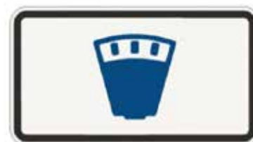
Dodatková tabuľa: Platené parkovanie.

Pozor však na „rýchloobrátkové parkoviská“. Ide o parkoviská na Ul. SNP (pri MsÚ), na Ul. J. Kráľa (za obchodným domom Cieľ) a na Ul. Hviezdoslavovej (pri Eurodome). Na týchto parkoviskách je možné v pracovných dňoch v čase od 6.00 h do 17.00 hodiny využiť parkovanie a státi len zakúpením parkovacieho lístka prostredníctvom SMS. Parkovacia karta je teda v pracovných dňoch platná len mimo uvedeného času. Informačné značky na týchto parkoviskách informujú, že ide o „rýchloobrátkové parkovisko“.