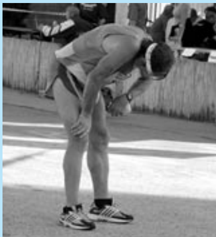
Prvý pohľad v cieľi patrí hodinkám.

v tieni stromov na štefanovskej a búranskej periférii vystriedala znova páľava. Začala sa ozývať aj achillovka na pravej nohe, protestovala proti námahe. Napokon prišlo tiahle stúpanie do Šaštína. Ešte bolo treba vydolovať zvyšky síl na okruhu mestčekom. Konečne sa objavil cieľ na námestí.