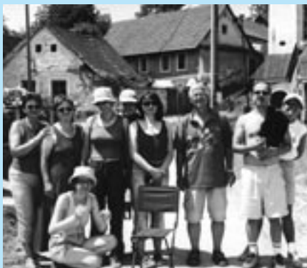
Dospelí účastníci výtvarného odboru ZUŠ v Senici na plenéri v areáli habánskeho dvora v Sobotišti.

Koncom júna sa uskutočnil plánovaný plenér pre dospelých - kreslenie a maľovanie v prírode. Bola sobota 25. jún. Ráno bolo slnečné a všetko nasvedčovalo tomu, že nás čaká pekný pracovný deň. Do áut sme naložili potrebné stojany a ostatné