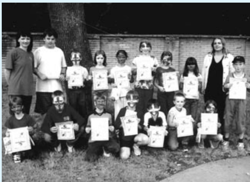
Mestský tábor v CVČ so zameraním na angličtinu a výtvarnú výchovu bol plný veselosti, hier a smiechu. Viac na strane 5.