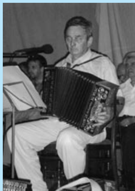
Z posedenia heligónkarov.