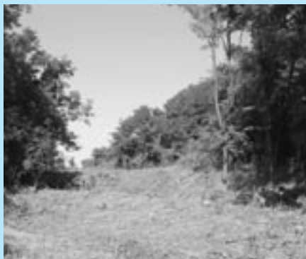
Priesek porastom v miestach, kde sa bude cyklotrasa zo Sotiny zvažovať k potoku.

3. vetva Kunov vedie od Kunova, od bývalého dvora JRD cez potok Teplica a napája sa na vybudovanú cyklotrasu.