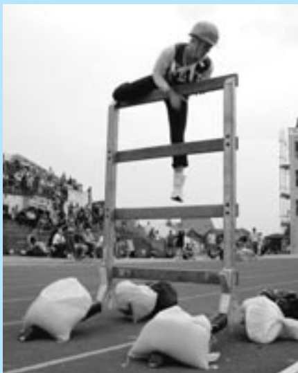
Súčasťou štafety bola rebríková stena.

Ženy plnili dve súťažné disciplíny: požiarne útok s vodou a štafetu 4x100 metrov. Seničanky doplatili na odlišnosť pravidiel, ktoré platia v zahraničí. Odlišnosť je hlavne v štafete. Podľa našich pravidiel sa beží 8x50 m, podľa pravidiel CTIF 4x100 m. V našich súťažiach nepoužívame vôbec rebríkovú stenu ani kladinu, ktorá je veľmi náročná. Ďalšia podstatná odlišnosť je v hasení, keď v našich pravidlách nie je stanovené hasenie plameňa. Pri požiarne útoky používajú dinkové saviče a pri hasení ohňa rotkové hadice.