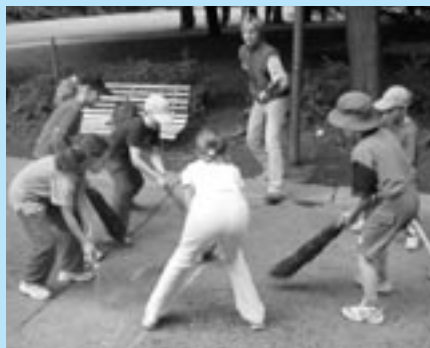
K správnym čarodejníkom patrí i metlobal.

Lenže veľa detí zo Senice a okolia, takmer sedemdesiat, ponuku sovy prijalo a zúčastnilo sa výcviku čarodejníckych učňov - detského letného tábora v Skalických horách - v Údolí duchov, konkrétne v pevnosti Na pavučom vrchu. Tábor organizovalo Centrum voľného času Stonožka.