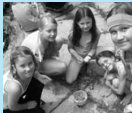
Elixír všetkým chutil...

Malí učni boli zaradení do jednotlivých čarodejníckych družín, pre ktoré si vymysleli zaujímavé názvy a tiež vlastné zaklínadlá. Tie