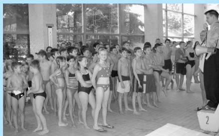
Malí „kapríci“ z Dvojky.