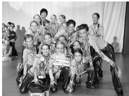
Tanečníci v Liptovskom Hrádku získali 2. miesto v disco dance formáciách DVK.