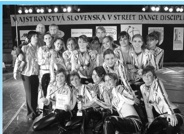
Na súťaži v Šali v hlavnej vekovej kategórii obsadil Scream v disco dance formáciách 1. miesto.