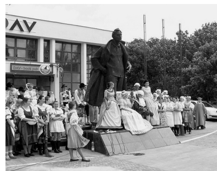
Program Humanus via.