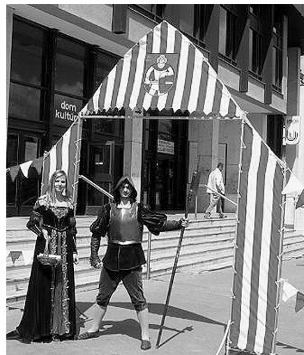
Mýtna brána - pripomienka tridsiatkovej stanice na tzv. Českej ceste.

P.S. Keby som nosil klobúk, tak ho grációzne zložím z hlavy a pokloním sa na znak úcty pred dobre vykonanou prácou (len sa nesmiem moc zohýbať, lebo by som sa kvôli križom nemusel narovnať -ale to je tá najjednoduchšia diagnóza akú mám).