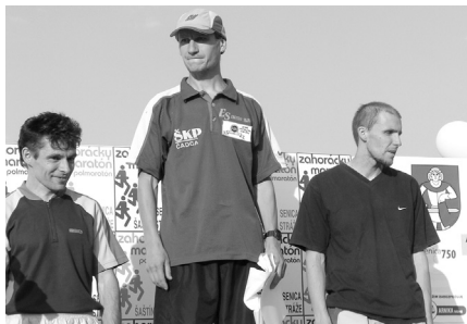
Víťazi ZM kategórie do 40 rokov.

Terajšia skúsenosť, keď víťazom maratónu sa stal pretekár z vyššej vekovej kategórie, viedla organizátorov k tomu, aby na budúci 19. ročník upravili pravidlá v tomto zmysle.