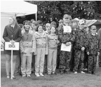
Družstvá dievčat a chlapcov na súťaži v Mliečne.

Všetko sa to začalo 5. mája, keď sme odišli na sústredenie na Záhorie. Spolu nás tam bolo 25, z toho 3 vedúci. Počas 4 krásnych dní sme neustále trénovali všetky disciplíny - štafetový beh 8x50m, štafetu CTIF, požiarneho útoku s vodou a nechýbala ani teória. Boli to dni tvrdého nácviku od rána až do večera. Tento rok je v súťaži hry Plameň postupový a robili sme preto všetko, aby boli družstvá na súťaž dostatočne priprave-