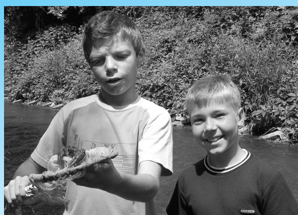
Aké budú prázdninové dobrodružstvá? Rak z Teplíce uprostred Senice.