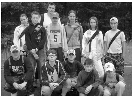
Vitazné družstvo záverečnej disciplíny preťahovanie lanom z I. ZŠ Senica, ktoré získalo putovný pohár.

Na delostreleckej prípravnej strelnici sa 22. júna uskutočnil 1. ročník branného preteku žiakov senických základných škôl a ZŠ Šaštín. Hlavným organizátorom bolo občianske združenie Delostrelec. Spoluorganizátormi boli Oblastný výbor SZPB Senica, ZOS Senica, Výskumný ústav Záhorie a Autoškola Progres. Preteku sa zúčastnilo 38 žiakov spolu s pedagógmi z každej senickej školy. Súťažilo sa v kategórii dievčat a chlapcov. Žiaci počas preteku prechádzali desiatimi stanoviskami, kde mali možnosť overiť si vedomosti pri určovaní živočíchov a rastlín nášho regiónu. Zručnosti si preverovali pri prekonávaní prekážky, strelbe zo vzduchovky, hode granátom, hádzaní bremenom na diaľku, skoku do diaľky, navliekaní krúžkov, odhade vzdialeností i štafeto- voma preteku družstiev. Samozrejme nechýbala ani zdravotnícka príprava.