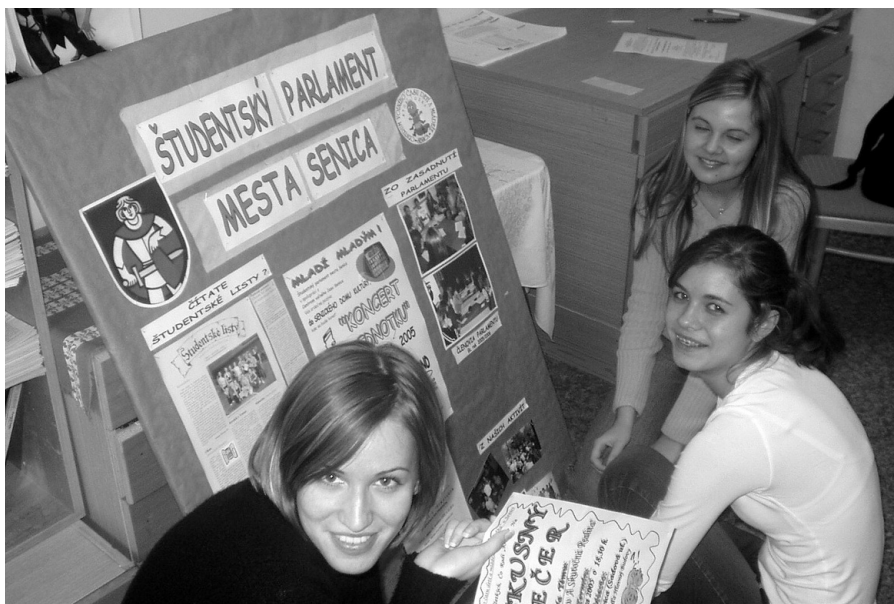
Študentský parlament svoje aktivity zverejňuje aj na vývesnej tabuli v strede mesta.

Bolo toho dosť a stále ideme na plný plyn. Ale po poriadku. Od novembrového úspešného Dňa študentstva a trochu menej úspešného (čo sa návštevnosti týka) koncertu na jednotku nadviazal Študentský parlament spoluprácu s kanceláriou Europe direct na MsÚ, najmä v súvislosti s projektom o participácii mladých v meste a zapojenia sa niektorých členov ŠP do pracovných komisií projektu. Podarilo sa nám nadviazať spoluprácu s hodonínskym parlamentom, pomerne sa darí i činnosť pracovných sekcií parlamentu, v januári sme zasadali s primátorom mesta a po menších parlamentných prázdninách vo februári a marci sme sa od apríla opäť naplno rozbehli. Škoda len, že sa naše rady v priebehu roka preriedili a zostalo 10 - 12 verných, ktorí chápú o čom to celé je. V tejto zos-