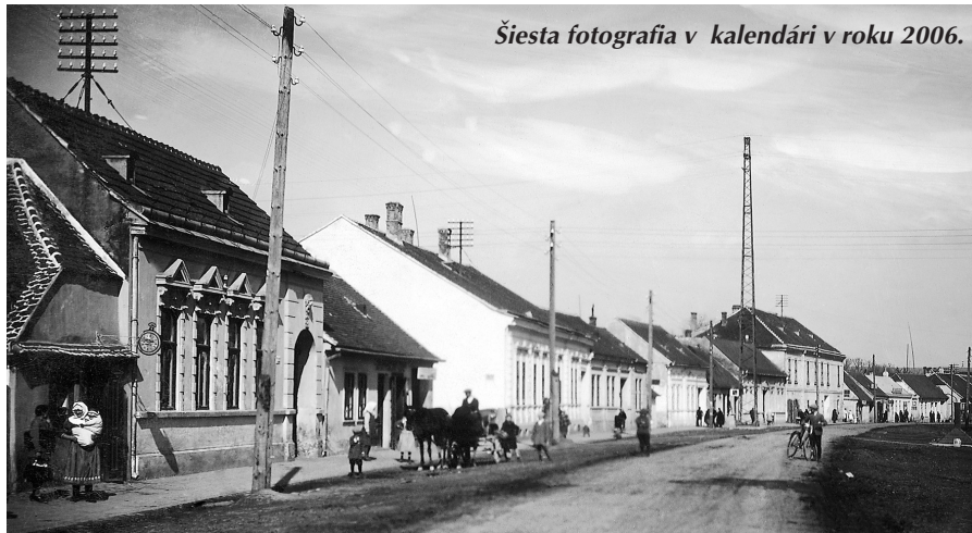
Šiesta fotografia v kalendári v roku 2006.