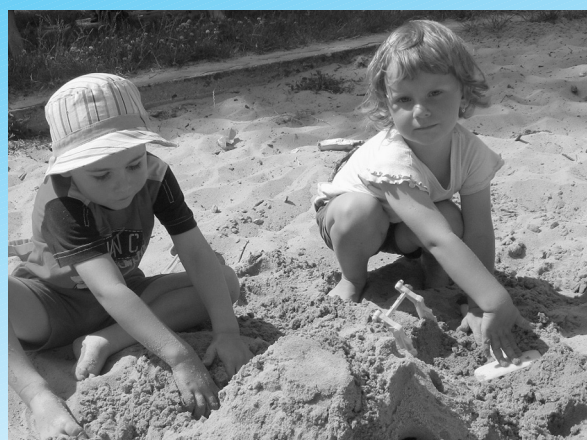
Podoby leta.

Najlepšia úroda jačmeňa bola asi zatiaľ na tomto poli, 3,5 tony z hektára. (pokračovanie na str. 4)