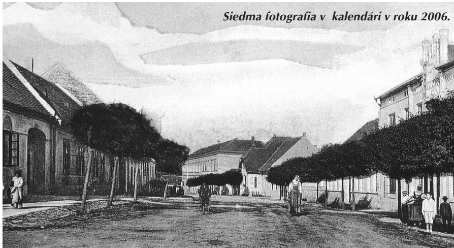
Siedma fotografia v kalendári v roku 2006.