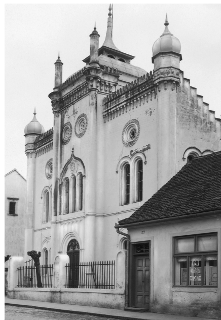
Senická synagóga je dávno minulosťou.