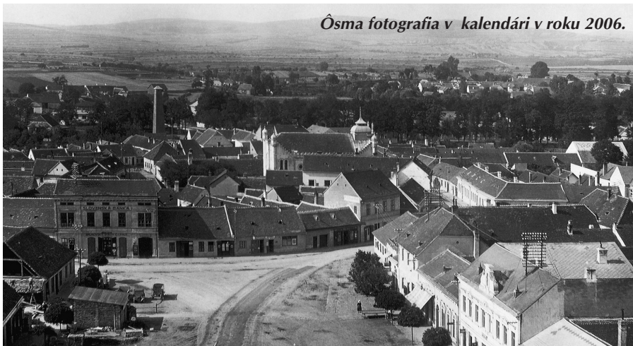
Ôsma fotografia v kalendári v roku 2006.