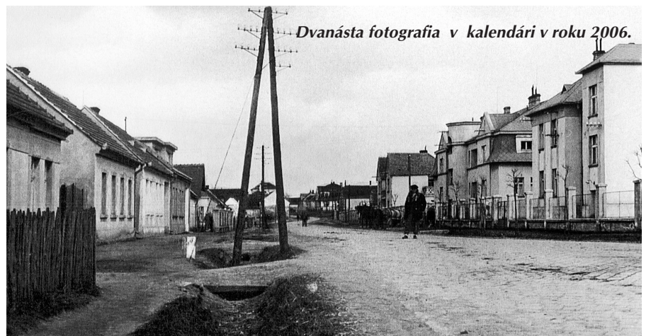
Dvanásť fotografia v kalendári v roku 2006.