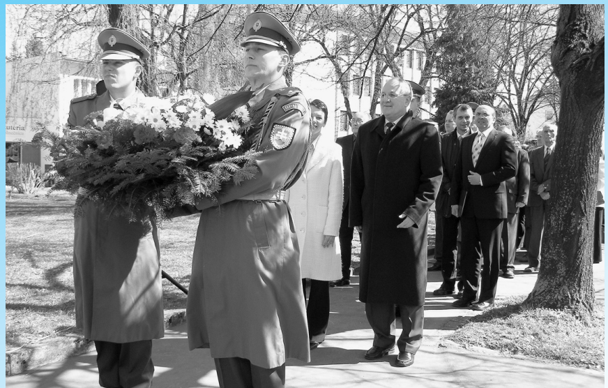
Pietna spomienka pri príležitosti oslobodenia Senice 5. apríla.