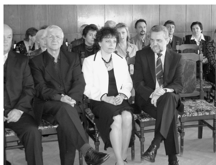
Pohľad na časť ocenených učiteľov