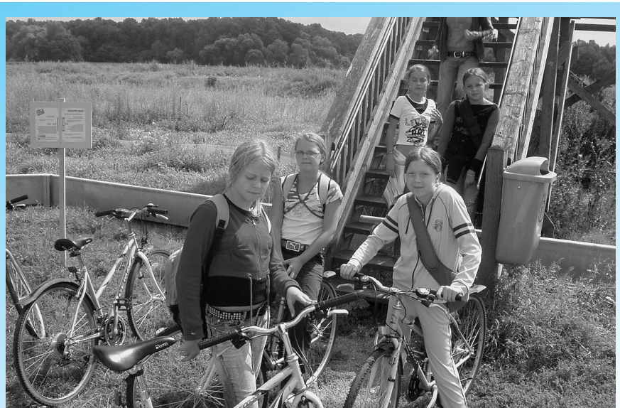
Deti - naša budúcnosť. Akú im ju pripravíme?