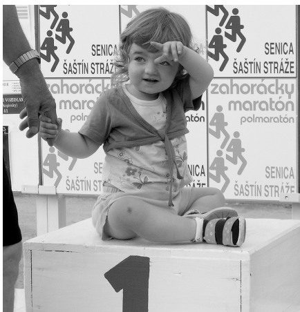
Budúca víťazka Záhorského maratónu?

Pre víťaza hlavnej kategórie je pripravená odmena 6 000 Sk. Absolútny víťaz získa 4 000 Sk. Osobitná prémie 5 000 Sk je určená pre víťaza, ktorý prekoná traťový rekord 2:23,42. V ostatných kategóriách získajú traja najlepší finančné odmeny a pretekári na 4. až 6. mieste vecné ceny. Najlepší Seničan získa cenu primátora Senice a prvý na obrátke získa cenu primátora mesta Šaštín-Stráže. V polmaratóne sú vo všetkých kategóriách pre bežcov na prvých troch miestach určené vecné ceny.