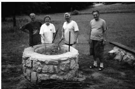
Pred chatou vyrástlo nové ohnisko.

Jednotlivé trasy boli dobre značené, turisti si preto mohli vybrať z viacerých možností. Na štarte boli pripravené orientačné tabule a mapy. Predchádzajúce dažďové a búrkové dni odradili časť turistov, a tak sa nás zišlo v Malých Karpatoch iba 49. Počasie sa „umúdrilo“ a v sobotu 23. júna bol krásny deň. Prišli turisti z Holiča, Kútov, Sobotišťa, Čárov, Jablonice, Trenčína, naši zo Senice, ba i z Prahy. A dokonca štyria turisti z Budapešti, ktorí obchádzali naše malokarpatské hrady a pri ich ceste na Korlátko sme ich nasmerovali na našu trasu. Posedeli sme s nimi na terase pri chate a boli nadšení atmosférou.