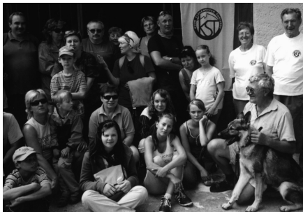
Časť účastníkov Regionálneho zrazu turistov.

Klub slovenských turistov (KST) Senica v spolupráci s Regionálnou radou KST zorganizoval v dňoch 22. - 24. júna 47. ročník Regionálneho zrazu turistov v Malých Karpatoch. Turistická akcia sa konala v okolí Chaty SNP na Rozbehoch.