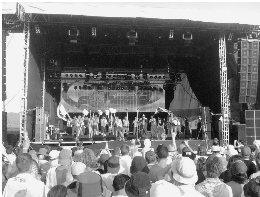
Foto jedného z najväčších letných festivalov na Slovensku - Bažant pohoda 2007.