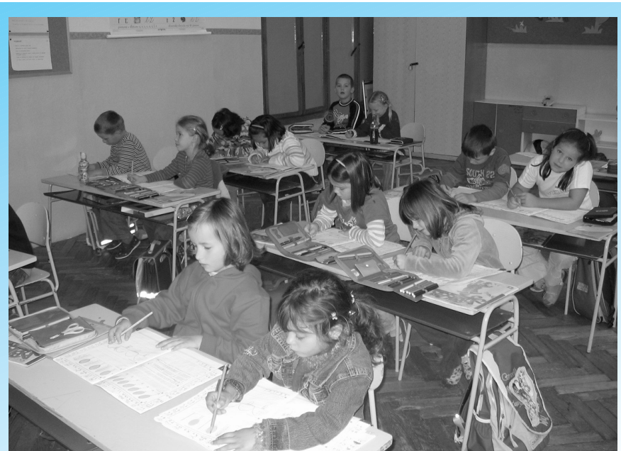
Škoda, prázdniny už sú za nami...

Školy venujú dostatočnú pozornosť kvalite riadenia pedagogického procesu, jeho analýze, efektívnemu plánovaniu i následnej kontrole. (pokr. na str. 4)