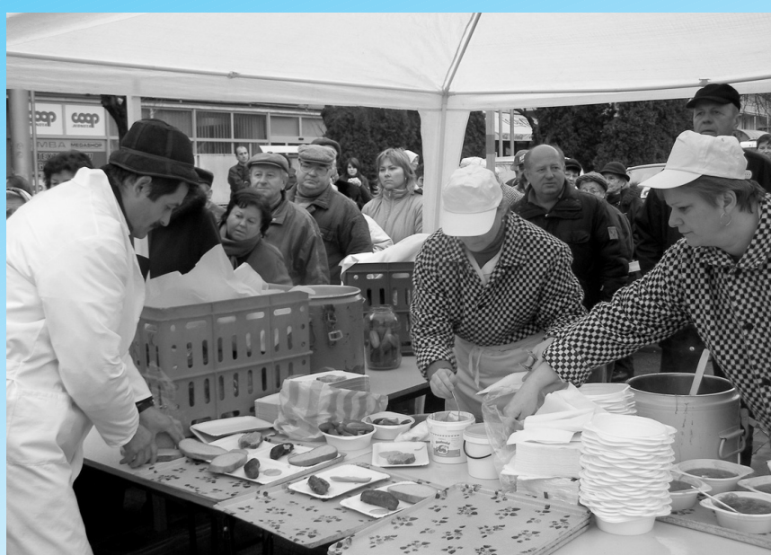
Na ochutnávku zabíjačkových špecialít sa tešilo veľa Seničanov.