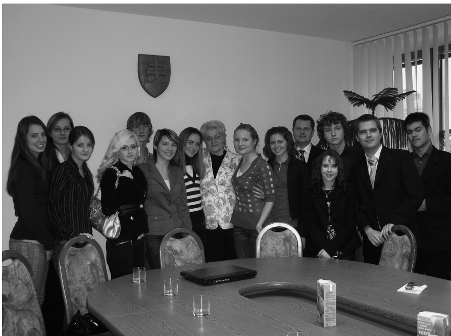
Členovia Študentského parlamentu s ministerkou Vierou Tomanovou.

VT: Nie. Aj v mojom prípade môžem povedať, že využívam všetky vedomosti, ktoré som nadobudla na zdravotníckej i na ekonomickej škole. Všetky vedomosti dokáže človek v živote využiť. Ani jedna informácia, ktorú získate, nie je zbytočná.