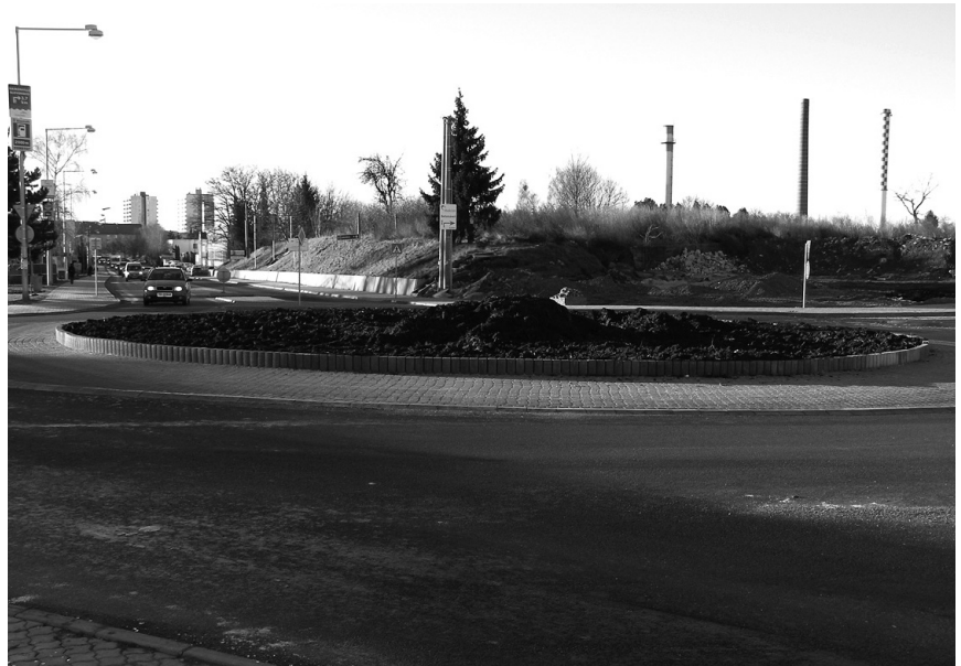
Od okružnej križovatky smerom na Párovce sa buduje 250 m komunikácie, kde vyrastie obchodná zóna. Prvými budú Kaufland a Family centrum.