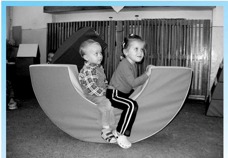
Deti v Materskej škole – elokovaná trieda sanatórium – sa od októbra tešia novej rehabilitačnej zostave, ktorú získali z projektu Zdravé deti – naša budúcnosť II.